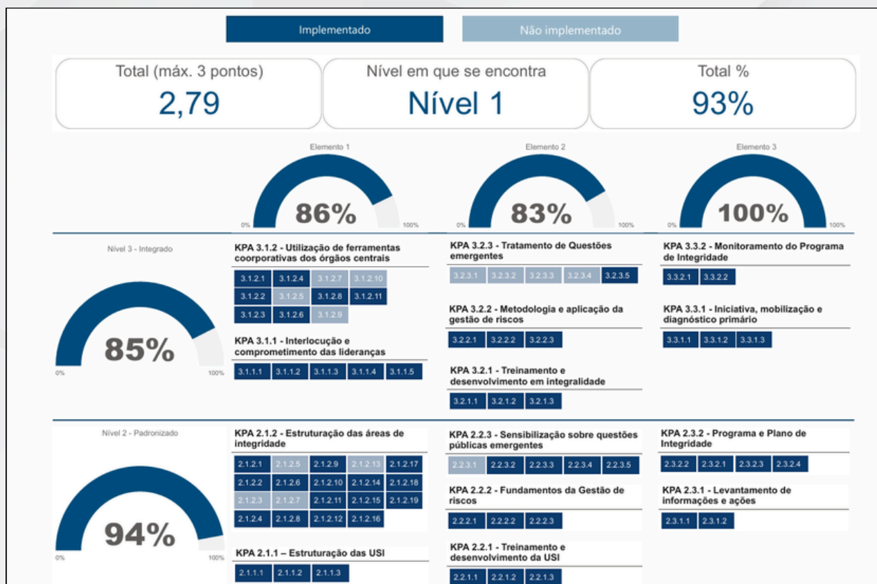
Figura 1: Resultado da avaliação MMIP.

Em 2025, a Universidade Federal do Maranhão recebeu o resultado da autoavaliação institucional da gestão da integridade com base no Modelo de Maturidade em Integridade Pública (MMIP), instrumento desenvolvido pela Controladoria-Geral da União (CGU) para apoiar os órgãos e entidades da administração pública federal no diagnóstico e no aprimoramento de seus programas de integridade. O modelo estrutura a avaliação em níveis progressivos de maturidade e em elementos que contemplam aspectos relacionados à governança da integridade, à capacidade organizacional e à gestão e desempenho das ações implementadas. Os resultados apontados foram apresentados da seguinte forma: