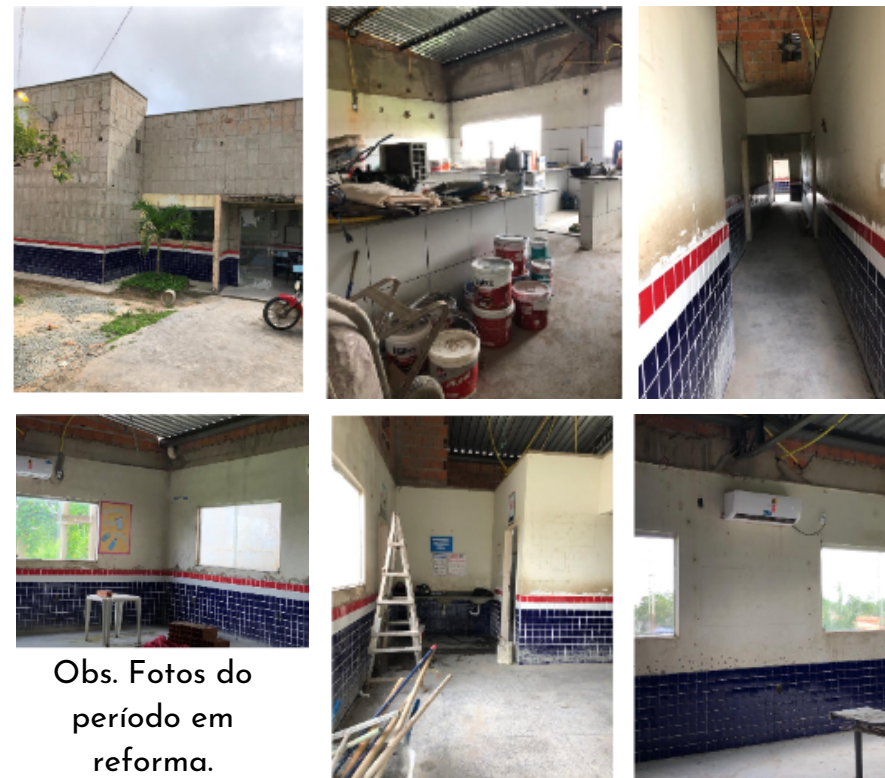
Obs. Fotos do período em reforma.