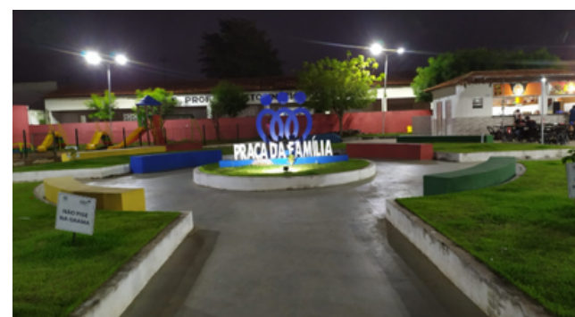
Praça da família