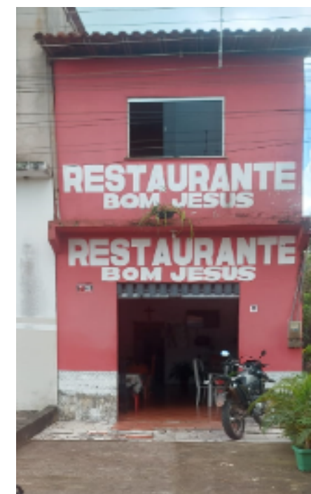
Restaurante Bom Jesus