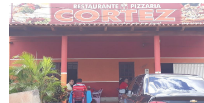
Restaurante e Pizzaria Cortez Serve Self