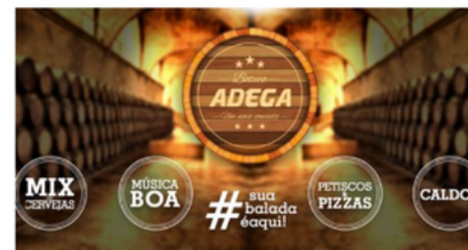
Restaurante e Boteco AdegA

Centro da Cidade, com Vista para Igreja Matriz Catedral