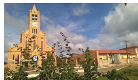
Igreja Nosso Senhor do Bonfim

A catedral é um símbolo da cidade. Foi erguida em 1941, sob a coordenação do frei Gentil Gianellini, da ordem capuchinhos.