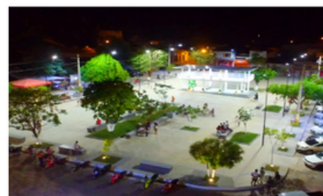
Praça Raimundo Simas

Centro da Cidade, com Vista para Igreja Matriz Catedral