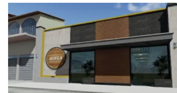
Restaurante e Boteco AdegA Serve Self