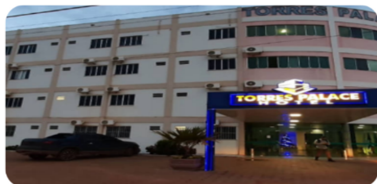
Torres Palace Hotel