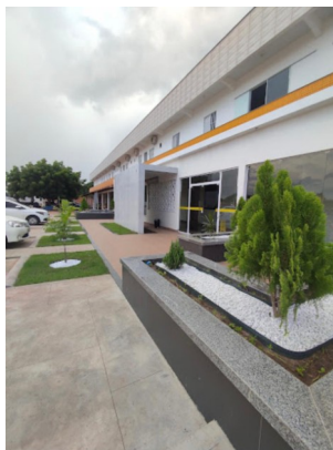
HOTEL ALANA Endereço: ROD MA, Rua Zé Gomes, 230 - KM 67, Brejo - MA, 65520-000 Contato: (98) 98554-4371