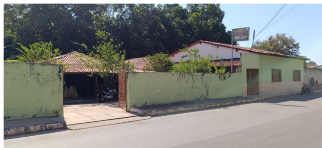
HOTEL E RESTAURANTE ESTRIBAR Rua Gonçalves Dias 1338, próximo a AABBB Contato: (98) 99981747089