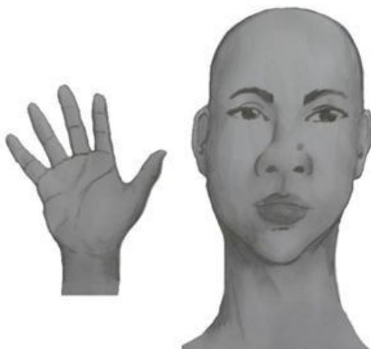
Perfil Frontal, apresentando a palma da mão direita