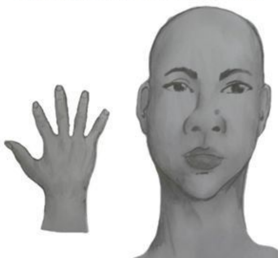
Perfil frontal, apresentando costado da mão direita