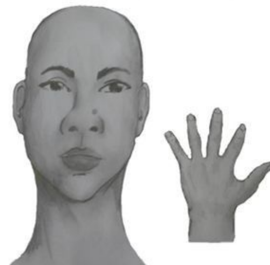
Perfil frontal, apresentando costado da mão esquerda